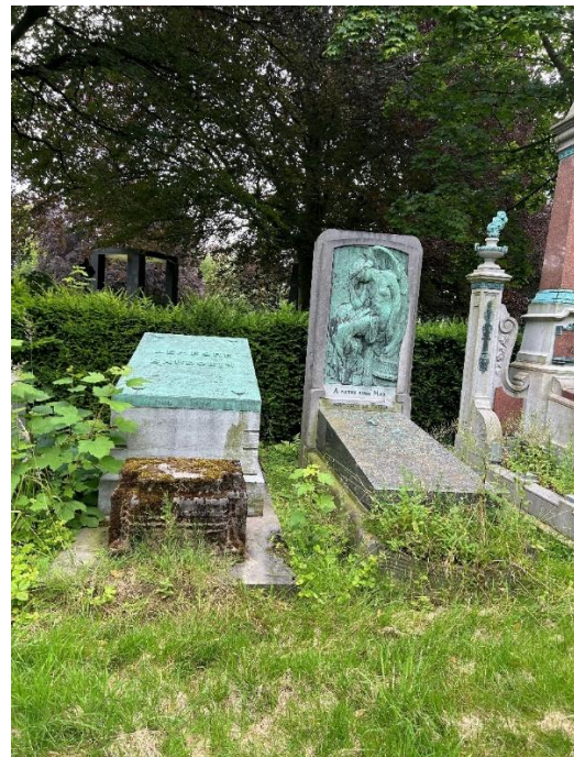
Nauwelaers - Lacourt (rechts) Lemesre – Baudouin (links)