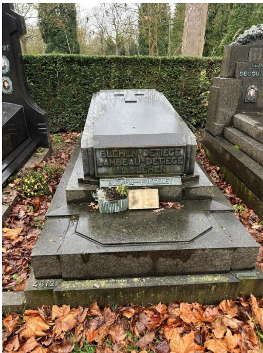
Bléhen – Detiège